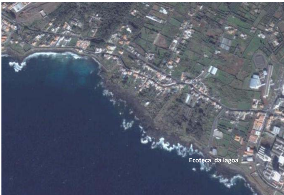
Área acção Ecoteca Lagoa

O ponto de encontro será no Observatório Vulcanológico e Geotérmico dos Açores OVGA, sito na Avenida Vulcanológica, Atalhada, onde os participantes e demais interessados poderão visitar a Exposição Fotográfica “A madrugada das Cagarras” de Paulo Henrique Silva.