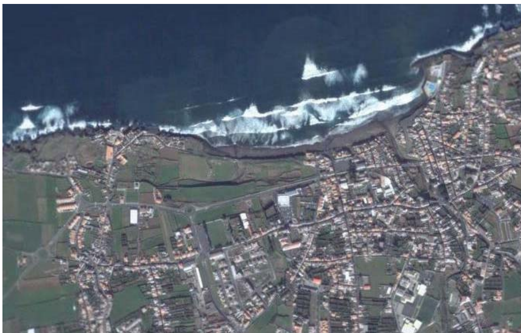
Área acção Ecoteca Ribeira Grande

O ponto de encontro será no Palheiro da Ribeira Grande.