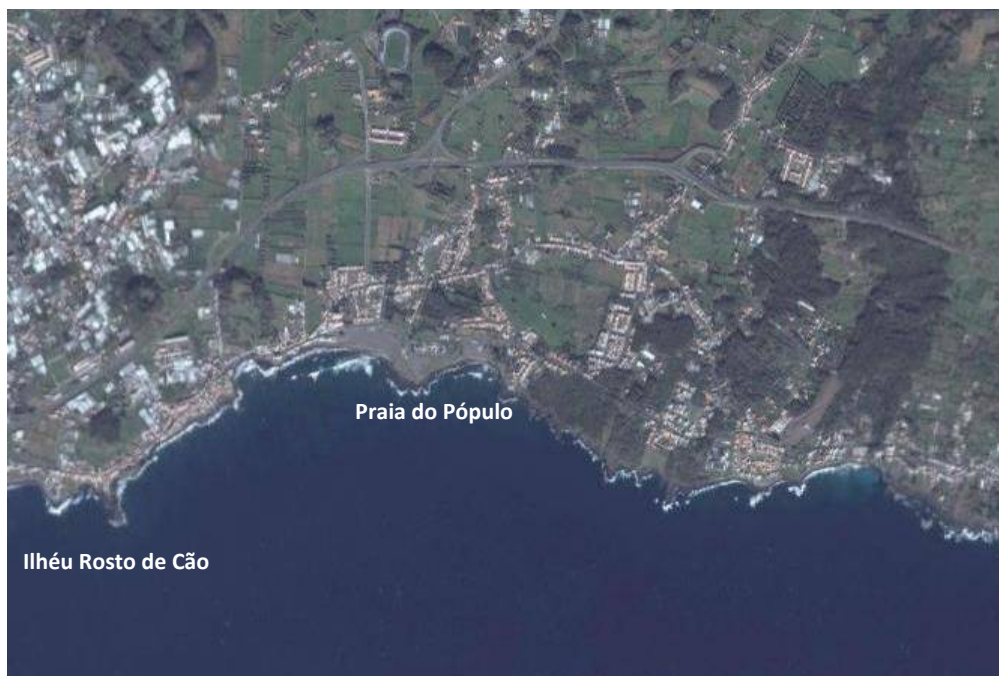
Área acção Ecoteca Ponta Delgada

O ponto de encontro será no parque de estacionamento da Praia “Pequena” do Pópulo.